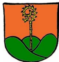
Wappen des Klosters Altenberg