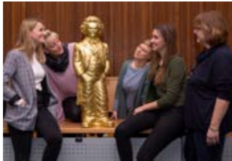
Das Kulturamt des Rheinisch-Bergischen Kreises mit dem Geburtstagskind

Impressum: Rheinisch-Bergischer Kreis, Der Landrat, Kulturamt, Am Rübezahlwald 7, 51469 Bergisch Gladbach, Tel.: 02202 13-2770, Fax: 02202 102765, www.rbk-direkt.de, E-Mail: kultur@rbk-online.de, Verantwortlicher Redakteur: Alexander Schiele, Text: Charlotte Loesch und Projektpartner, Layout/Design: Sabine Müller, Druckerei: Heider Die in dieser Broschüre in Szene gesetzte goldene Beethoven-Figur stammt von dem Künstler Ottmar Hörl.